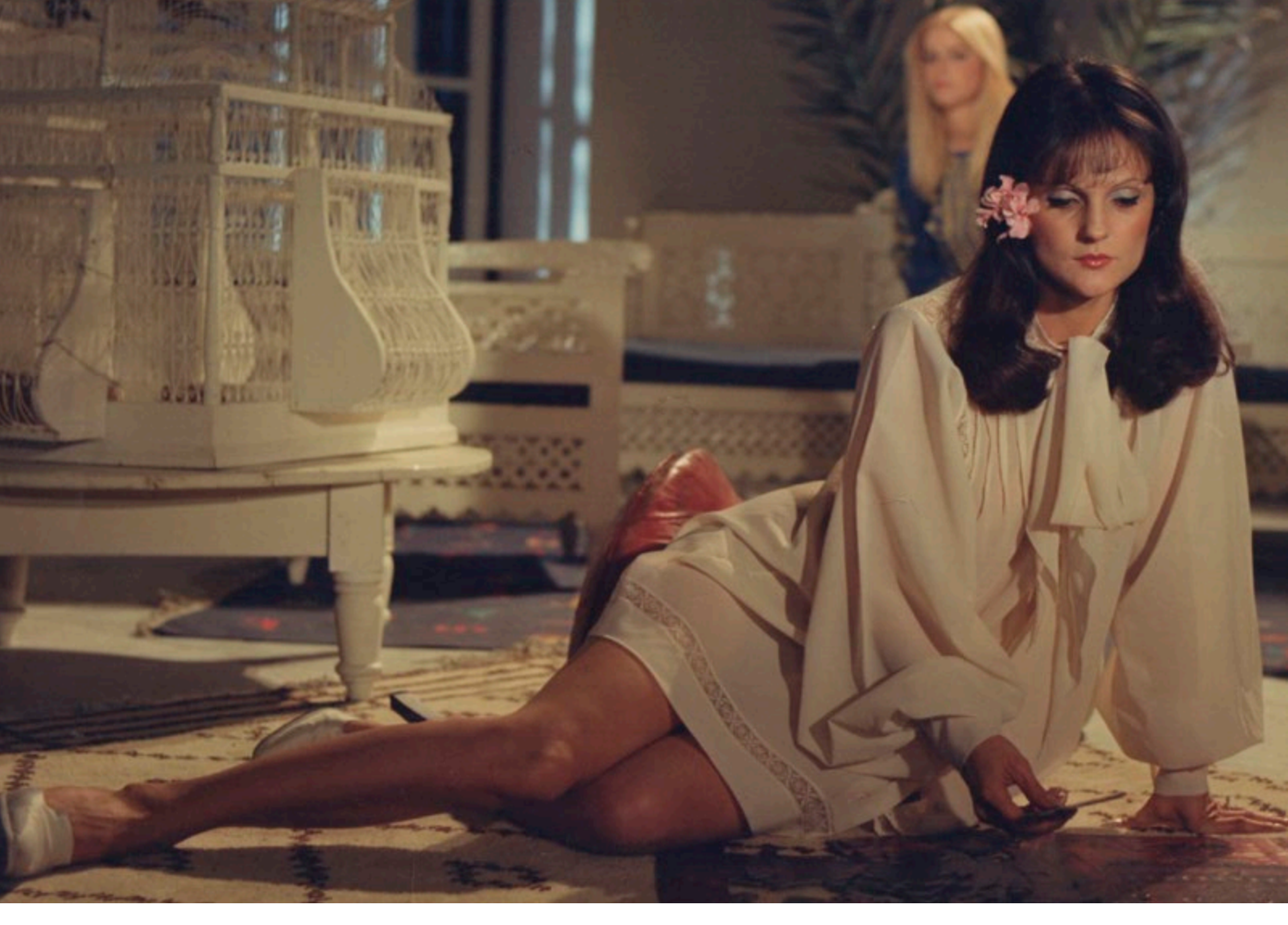
Inhibition , Paolo Poeti, 1976, Italia. Colección Fabio Manes.

Las fotos de la colección Fabio Manes forman parte de Cinepapel, Archivo Argentino de Afiches y Gráfica de Cine. Foto de portada: Alfredo Srur, Alessia , de la serie Familias , Buenos Aires, 1999.